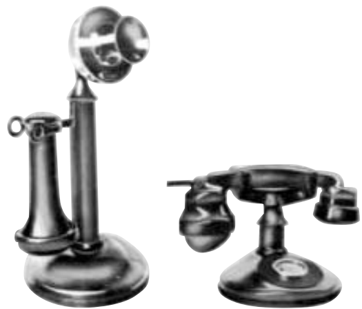
第2図 実用化された電話器 (左) アメリカ式：送話器と受話器は別であった。(右) フランス式：送話器と受話器は一体で、はじめは相互干渉があった。

電話は私達の社会通念を変えた。今日の携帯電話の普及をみればうなずけるだろう。電話機は家庭のなかでその居場所を確保した。歴史を振り返ると、人間の作り出した機械モノが家庭の中で位置を占めるのは時計、つづいて電話・電球であろうか。