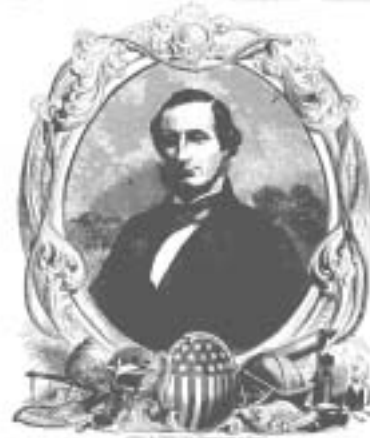
第3図 Harper's Weekly, Sep.1858 （開通特別号サイラス・フィールド）