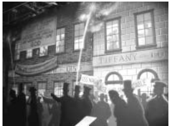
第2図 ニューヨークの大西洋海底ケーブル祝賀パレード 1858（安政5）年（スミソニアン・アメリカ歴史博物館展示）