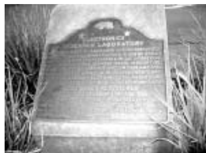
第3図 カリフォルニア州ランドマーク836号，Federal Telegraph跡（1909、パロアルト），ド・フォレストが三極管の実験をした。